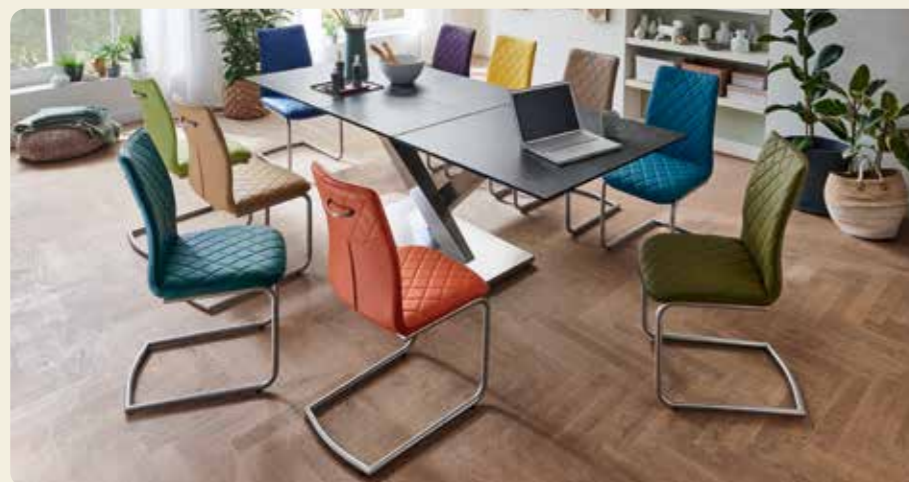
MONDO special Edition: Happy Colors.

Bezug Echtleder Stone, Gestell Edelstahl